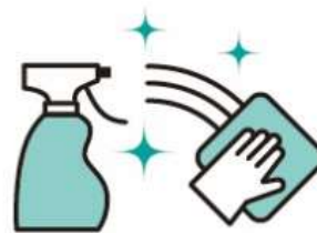
テーブルや椅子など、 手の触れる場所の除菌