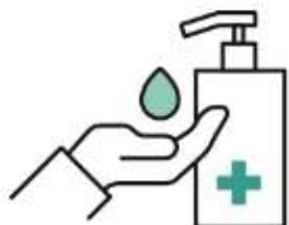
ご来店時、お客様へ 消毒のご協力