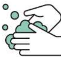
手洗い・うがいの励行