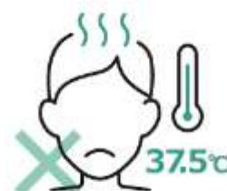
スタッフの体調管理