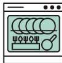
カトラリー・食器の 高温洗浄