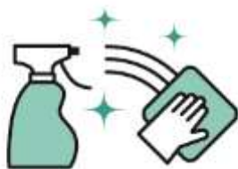
使用している備品類の定期的な消毒