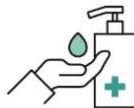
こまめな手先の消毒