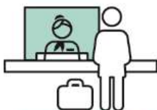
フロント、ベルデスクなど 各カウンターへアクリルパネルの設置