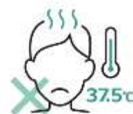
スタッフのこまめな 体調チェック