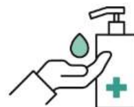
こまめな手先の消毒