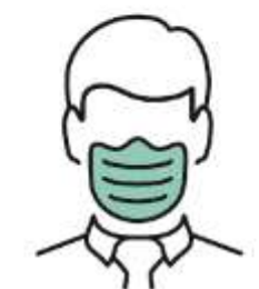
スタッフのマスク着用

ホテルニューオータニ鳥取では、スタッフの手洗い・うがい・手指の消毒を行うほか、ご宿泊いただくお客さまに安心してホテルをご利用いただけますよう、以下の対策に取り組んでおります。