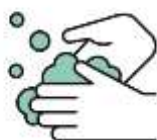
手洗い・うがいの励行