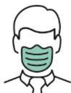
スタッフのマスク着用